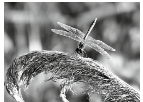
Oeverlibel bij het zonnepark