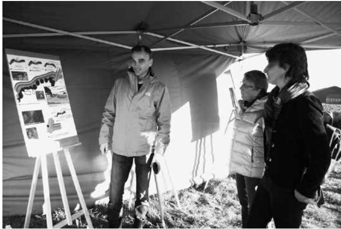
Veel belangstelling voor de plannen met het Boer Goensepad